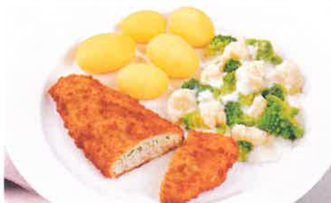
Panierter Alaska-Seelachs mit Kräuterfüllung (aus nachhaltiger Fischwirtschaft) dazu Romanesco, Blumenkohl und Brokkoli in Soße und Salzkartoffeln