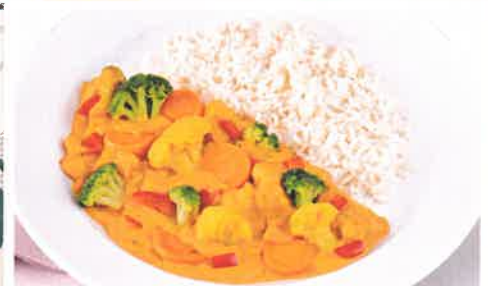
Pikante Gemüsepfanne in cremiger Currysoße mit Langkornreis