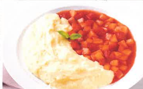
Cremiger Vollmilch-Grießbrei mit Erdbeer-Apfel-Kompott (mit Zucker(n) und Süßungsmittel)

Weitere Informationen zu unseren Frühjahrs- menüs finden Sie auf der Rückseite.