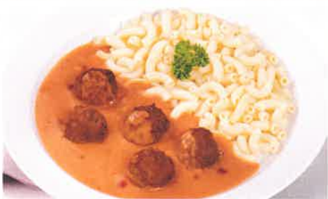
Hackbällchen vom Schwein und Rind in Preiselbeer-Sahne-Soße, dazu Hörchennudeln