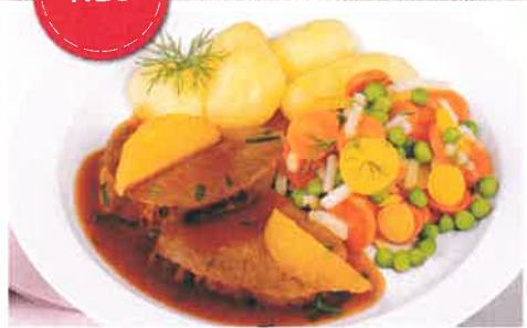
Zarter Kalbsbraten „à l'orange“ mit buntem Frühlingsgemüse und Salzkartoffeln