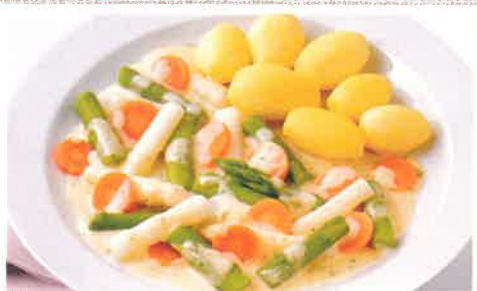
Buntes Spargelgemüse-Ragout in feiner Soße, dazu Salzkartoffeln